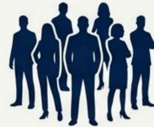
Output & Utenti